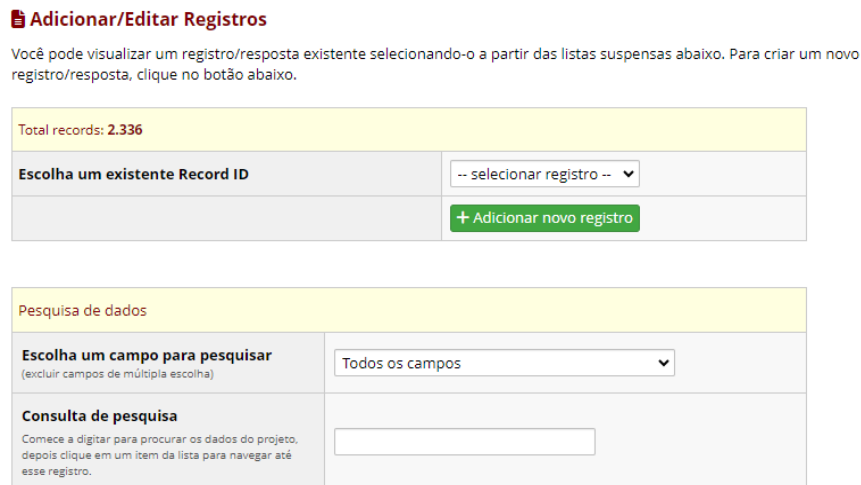
FIGURA 2 - TELA DA PLATAFORMA REDCAP PARA “ADICIONAR NOVO REGISTRO”

5.5 Preencher o campo data com o referente ao da coleta de dados feita no setor;