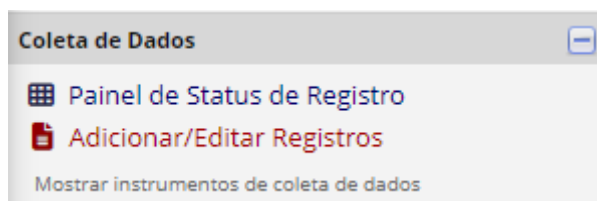
FIGURA 1 – TELA DA PLATAFORMA REDCAP PARA “ADICIONAR/EDITAR REGISTROS”